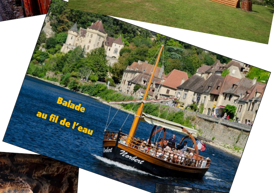
Balade au fil de l'eau