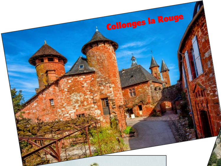
Collonges la Rouge