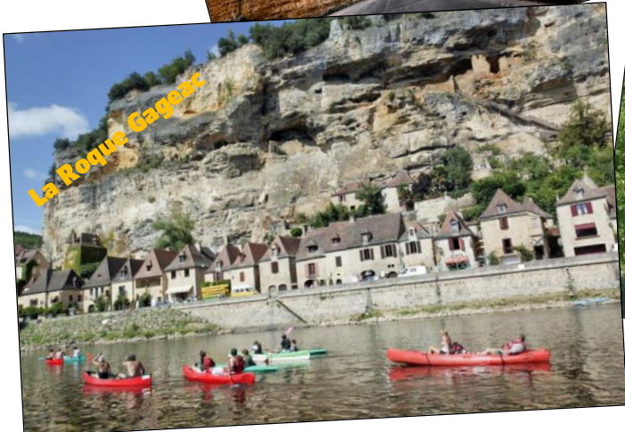
La Roque Gageac