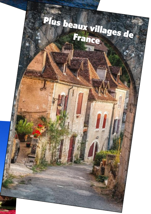
Plus beaux villages de France