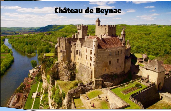
Château de Beynac