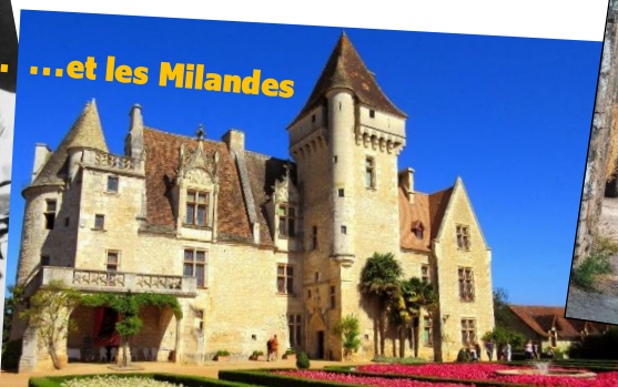
...et les Milandes